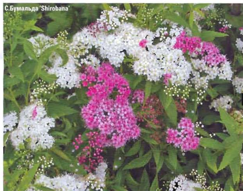
С. Бумальда 'Shirobana'