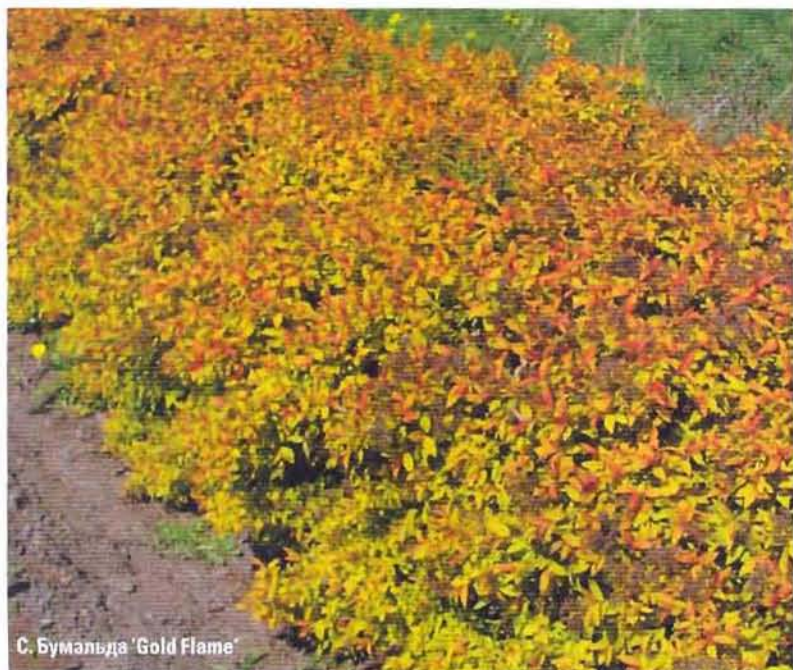
С. Бумальда 'Gold Flame'