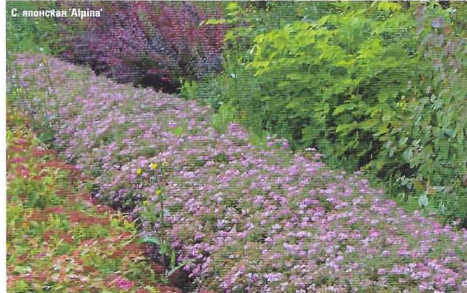
С. японская 'Alpina'

В средней полосе России не так много растений, отличающихся обильным цветением, поэтому спиреи по праву могут занять лидирующее положение в городском озеленении. Их можно использовать в одиночных и групповых посадках, живых изгородях различной высоты, садах непрерывного цветения, бордюрах, высаживать для закрепления откосов. Очень ценное качество растений — способность легко переносить пересадку.