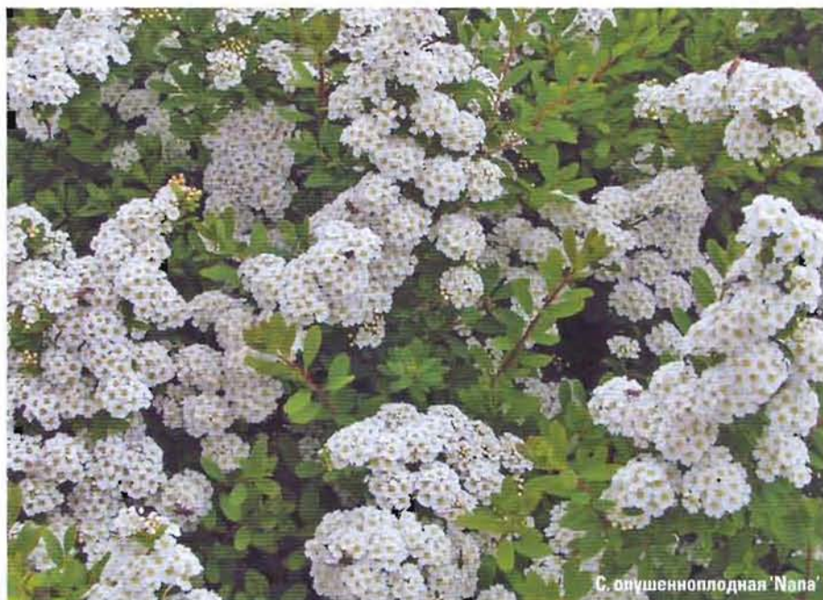
С. опушенноплодная 'Nana'

Пожухшие соцветия удаляют, они портят декоративность растения и истощают его. Сразу после сильной весенней обрезки кусты рыхлят и вносят азотные удобрения, а в июле – калийные и фосфорные. Почву лучше муль-