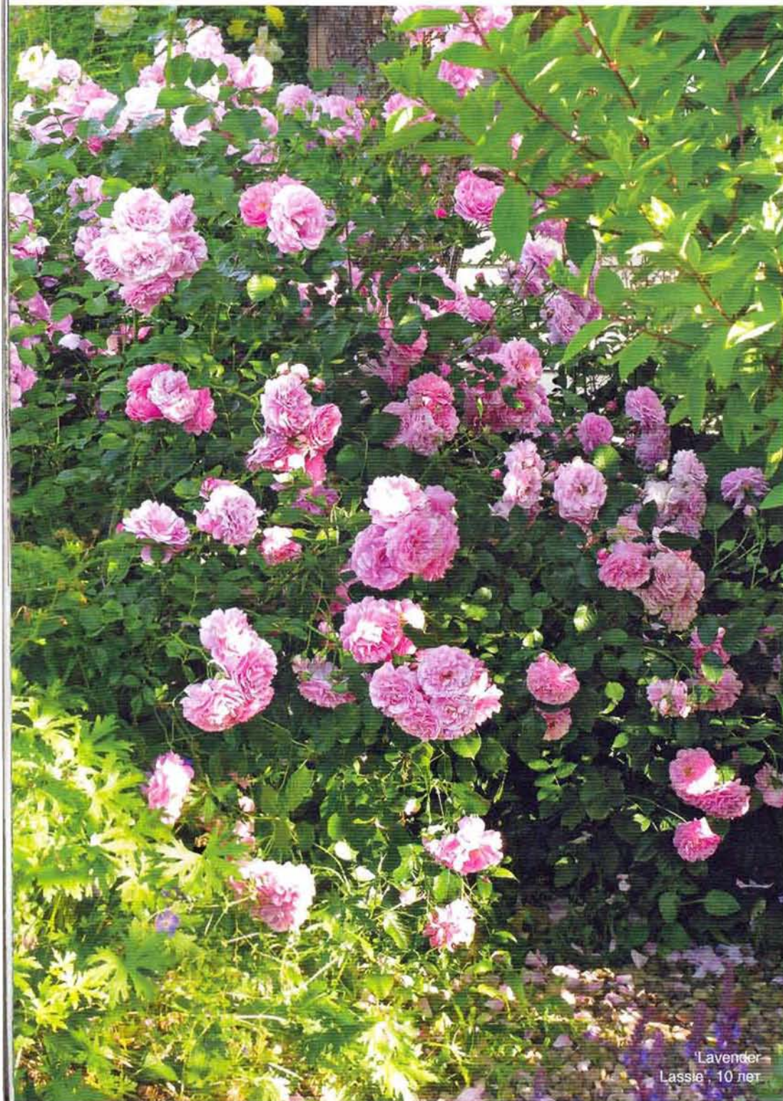
Lavender Lassie, 10 лет

Чаще всего физиологическое старение происходит после 8–10 лет жизни куста – точный срок зависит от ухода и качества саженца. Мы можем продлить жизнь розе, выполнив несколько несложных операций.