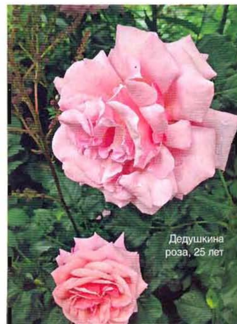
Дедушкина роза, 25 лет