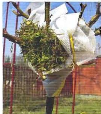
Обкладываем место прививки мхом