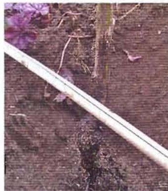
Обозначаем глубину посадки