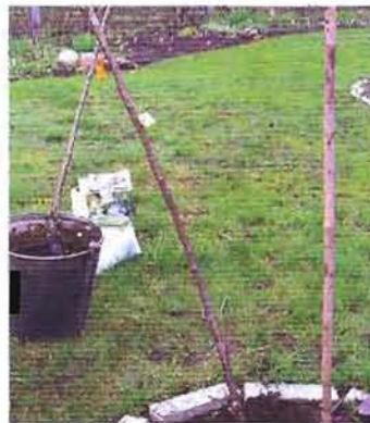
Штамб сажаем под углом