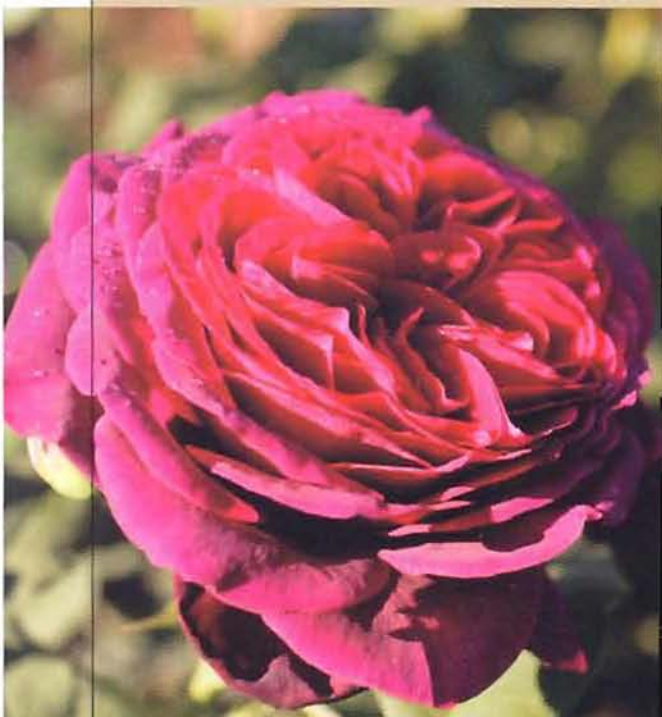
▷ 'The Mac Cartney Rose' (Meiland, 1992). Изысканная форма бутона и фантастический аромат перевешивают недостатки сорта. Некоторые находят цвет банальным, цветки рассыпающимся, а кусты излишне громоздкими и скуповатыми на цветки. Но аромат – непревзойденный!

◁ 'Astrid Grafyn von Hardenberg' (Rosen Tantau, 2001). Розы такой интенсивной бордово-пурпурной окраски имеют, как правило, сильный аромат. Но даже среди них Astrid Grafyn von Hardenberg' названа самой душистой розой 2002 года (Рим).