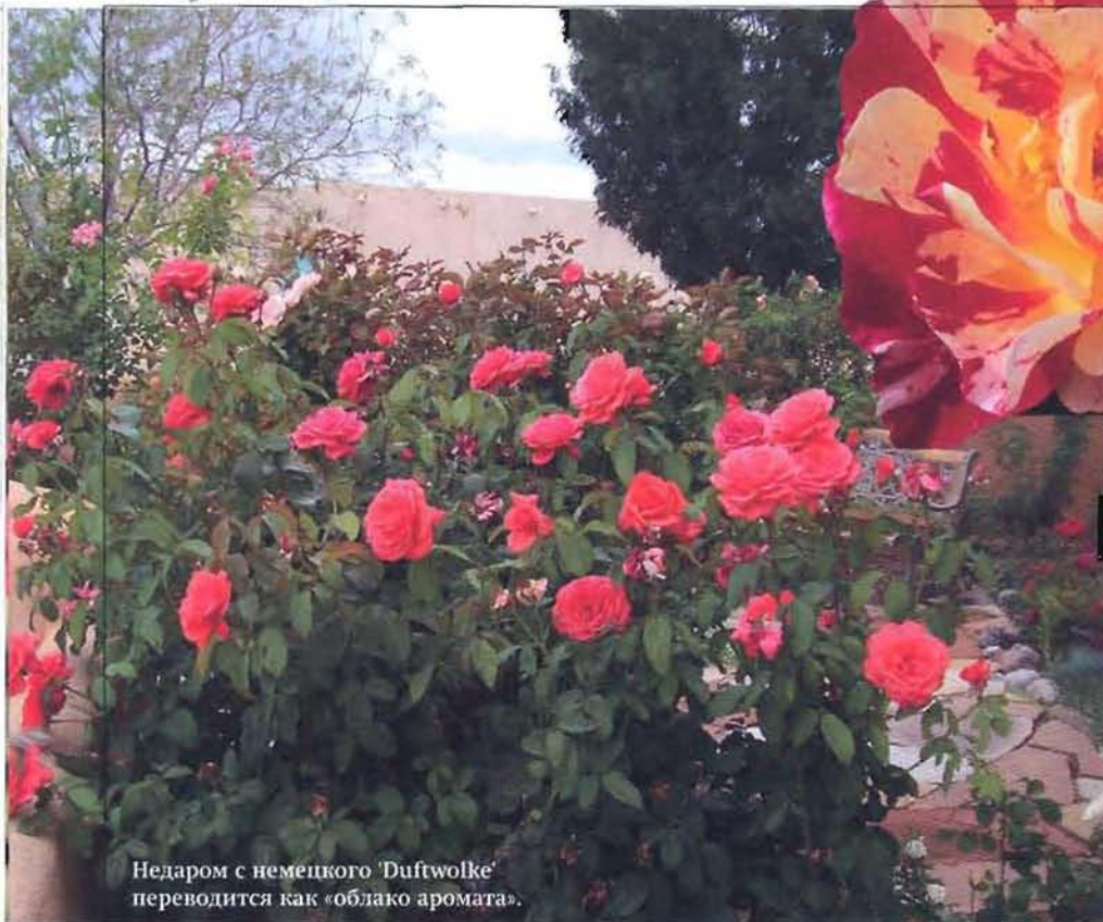
Недаром с немецкого 'Duftwolke' переводится как «облако аромата».

опровергла миф о том, что только старинные розы сильны своим ароматом, она получила высшие награды и титул Любимая Роза Мира (1972). Эта роза уже стала достоянием истории розоводства, но ее еще можно встретить в коллекциях. Вторая роза – гордость американской селекции 'Double Delight' (Ellis & Swim, 1976) – можно считать эталоном сладкого запаха. Эта роза тоже собрала все высшие награды мира, получила титул Любимая Роза Мира (1985) и прочно закрепилась в садах многих стран.