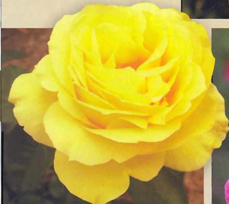
△ 'Souvenir de Marcel Proust' (Delbard, 1993) притягивает густомахровыми ярко-желтыми цветками. И покоряет ароматом с преобладанием тонов мяты, а чувствительные носы уловят ноты груши, абрикоса, корицы, сандала и даже сидра.