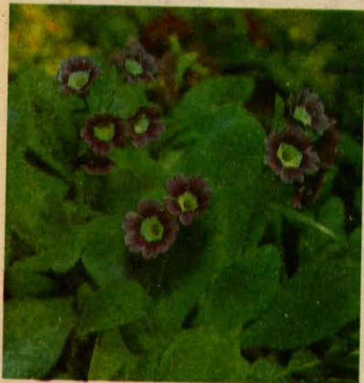
Примула ушковая (слева) и первоцвет обыкновенный

Примула мелкозубчатая ( P. denticulata ) в культуре с начала прошлого века. Привлекает внимание круглыми головчатыми соцветиями, 5—8 см в диаметре, из мелких цветков сиреновой, белой, лиловой, темно-фиолетовой, розовой окраски, которые появляются в конце апреля — начале мая до отрастания листьев. На одном растении может быть 5—7 соцветий. На темной земле цветы выглядят очень эффектно, привлекают к себе первых весенних бабочек. Шарик соцветий сидят на цветоносах высотой в начале цветения 10—15 см, отрастающих затем до 25—30 см. Цветоносы, а также листья с нижней стороны покрыты желтым муцистым налетом. Листья удлиненные, собраны в красивую розетку диаметром 35—40 см. Предпочитает светлые, увлажненные места.