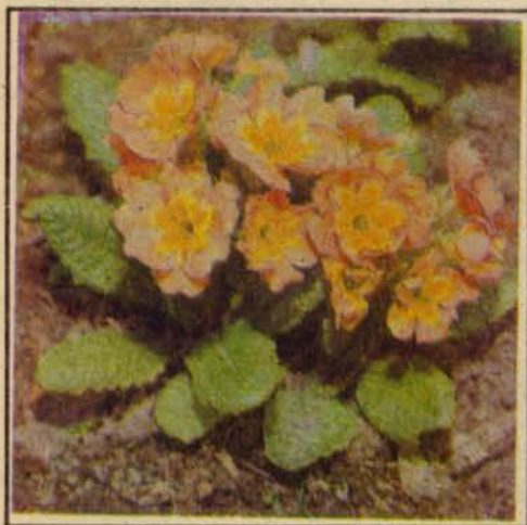
Гибрид примулы обыкновенной селекции Е. Константиновой

И вот, св. Юрий (23 апреля) встает, бросает их на землю, и вырастают из них первая бархатная травка и первые цветы — первоцвет.