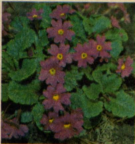
Группа гибридных примул (вверху слева), примула японская (внизу слева) и примула Юлии

При соблюдении всех правил агротехники примулы болеют редко. Но иногда в начале лета