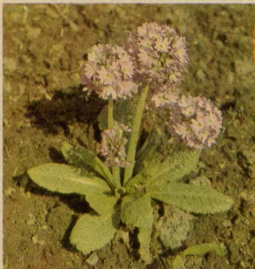
Примула мелкозубчатая (слева) и группа канделябровидных примул

В апреле-мае покрывается сплошным ковром пурпурных цветов первоцвет Юлии ( P. juliae ) — миниатюрное, до 5 см высотой растение с кожистыми блестящими округлыми листьями и оди-