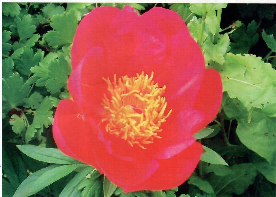
‘Флейм’ ( Flame )

Не устояла перед новыми веяниями, коралловые сорта уже растут в моем саду. ‘Пинк Хавайан Корал’ – ‘Pink Hawaiian Coral’ (Клем, 1981, США) и ‘Корал Чарм’ – ‘Coral Charm’ (Уинсинг, 1964, США) по-