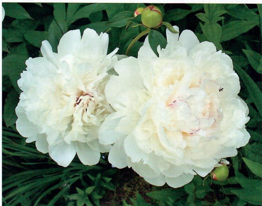
‘Фестива Максима’ ( Festiva Maxima )

на «японцев». Ну что тут поделаешь, я просто влюблена в их изысканную утонченность. В них неуловимая магия Востока, а Восток, как известно, дело тонкое. Внешне похожи на маки, такие необычные! Посмотрите в глазастые цветки сорта ‘Жемчужная Россыпь’ (Горобец, Тыран, 1989, СССР). Этот сорт покрывает нежными полутонами, мягкими пастельными оттенками, хотя обычно для пионов характерна пышность и яркость. Одно из достоинств сорта – быстрое нарастание, на третий год (при условии правильной посадки) это уже большой цветущий куст. Стебли прямые, высокие и прочные. Цветки – персиково-бежевое чудо. Венчик перламутровый. Стаминодии, видоизмененные тычинки в центре цветка, длинные, одного тона с венчиком, с золотистыми заостренными кончиками. Один из самых ранних молочноцветковых сортов. Диаметр цветка 14 см, высота куста 65 см.