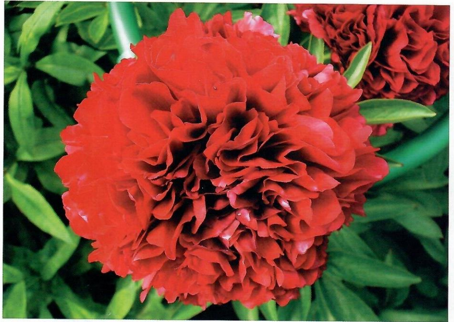
'Ред Грейс' ( 'Red Grace' )

Сорт 'Ред Грейс' – 'Red Grace' (Глазкок, 1980, США) – бордовое чудо.