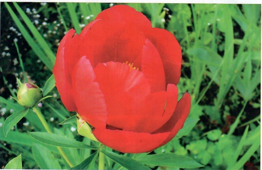
'Скарлет О 'Хара' ('Scarlet O'Hara')