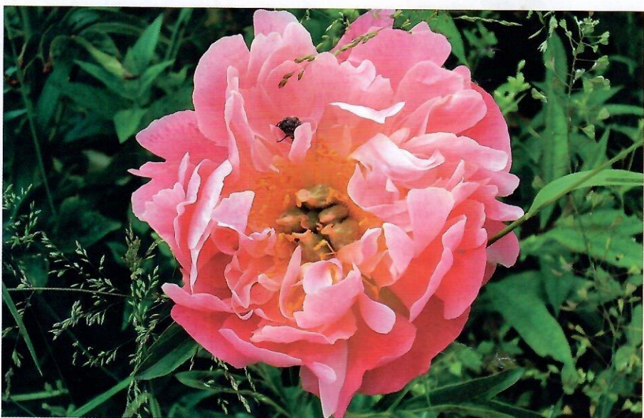
'Пинк Хавайан Корал' ('Pink Hawaiian Coral')