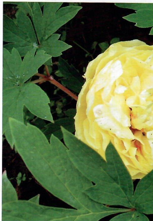
'Йелло Краун' ('Yellow Crowne')

блестящий, он в любимчиках у цветоводов. Крупный цветочек диаметром 16 см – красный, махровый, розовидный, и лепестки уложены так же красиво, как у розы. Хорошо растет на солнечном месте, не выгорает. Чтобы стебли не изгибались, требуется ранняя подвязка. Куст высокий, до 90 см. Листья без блеска. Очень живучий, черенкуется частями корней.