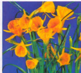
10 группа: 'Голден Беллз'

'Хиллстар' ('Hillstar', 1979) – 7YYW–YWW. Реверсный сорт. Ок – желтый с белым основанием, Ко – с желтым основанием, белая по краю.