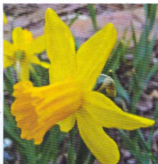
6 группа: 'Фебруари Голд'

'Сюзи' ('Suzu', 1954) – 7Y–O. Миниатюрный. Ок – с широкими заостренными лепестками, желтый, Ко – в форме чашечки, оранжевая. Поздний.