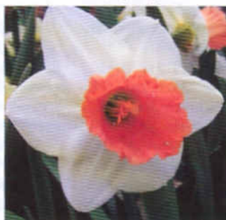
2 группа: 'Цветоводы Москвы' 'Берлин'

'Прикоушес' ('Precocious', 1976) – 2W-GPP. Ок – с крупными широкими лепестками (более правильно ботанически – долями), белый,