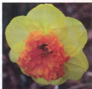
'Модерн Арт' 'Флауер Рекорд'