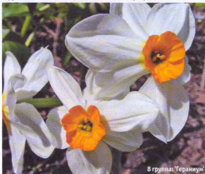
8 группа: 'Гераниум'