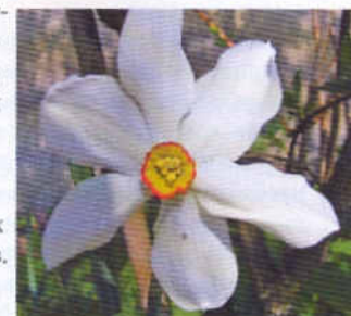
9 группа: 'Актеа'