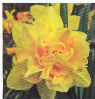
4 группа: 'Дик Вилден' 'Орегон Бьюти'

Группа 4 – Махровые. Популярная группа. Сорта старой селекции (белые и желтые) достаточно устойчивы; в большинстве – ранние и средние. Новинки розовых и красных окрасок в средней полосе