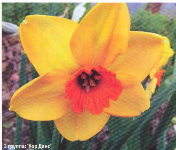
3 группа: 'Уор Дан'

Ко – темно-розовая с зеленым горлом. Популярный сорт. 'Сан Патрикс Дей' ('St. Patrick's Day', 1964) – 2Y-W. Реверсный. Ок – светло-желтый, Ко – белая. Среднеранний. 'Цветоводы Москвы' (сорт автора) – 2W-P. Ок – белый. Ко – вытянутая, ярко-розовая. Ранний. Группа 3 – Мелкокорончатые. По внешнему виду сходны с группой 9. Малораспространенные. От средних до поздних сроков цветения. Достаточно устойчивые. В России популярны сорта с контрастными красными и оранжевыми коронками. 'Матапан' ('Matapan', 1941) – 3W-R. Ок – белый, Ко – гофрированная, оранжево-красная. Средне-поздний. 'Эйприкот Дистинкшн' ('Apricot Distinction', 1942) – 3Y-O. Ок – абрикосово-кремовый, Ко – ярко-оранжевая. Средне-поздний. 'Уор Данс' ('War Dance', 1993) – 3O-R. Необычная окраска: Ок – темно-оранжевый, Ко – красная. Средне-поздний. 'Золото Скифов' (сорт автора) – 3Y-R. Ок – темно-желтый, Ко – оранжевая. Средне-поздний. Сеянец С 104.2 (выведен автором) – 3W-YWY. Ок – округлый, белый, Ко – зеленоватая в горле, основная часть белая, кромка желтая. Средний.