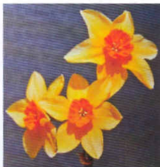
7 группа: 'Сюзи'