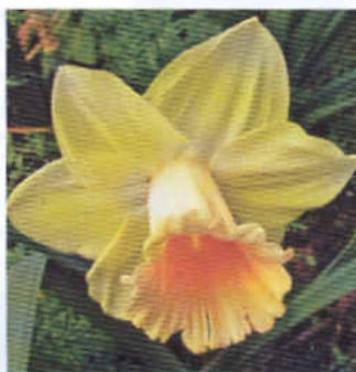
1 группа: 'Фиделити'

По-прежнему пользуются успехом у цветоводов многие старые культивары: 'Айс Фоллис' ('Ice Follies', 1953) – 2W-W; 'Бинки' ('Binkie', 1938) – 2Y-W; 'Ми Флери' ('Mei Fleirie') – 2W-Y; 'Оринж Айс Фоллис' ('Orange Ice Follies') – 2W-O; 'Профессор Эйнштейн' ('Pro-