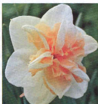
'Амстел' 'Дабл Дей'