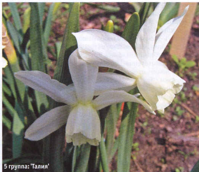
5 группа: 'Талия'

'Риплит' ('Replete', 1975) – 2W-P. Ок – белый, Ко – из рядов розовых и белых лепестков. Яркость розовой окраски зависит от погодных условий. Средний.