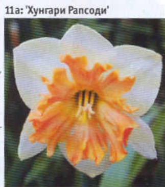
11а: 'Хунгари Рапсоди'

'Гераниум' ('Geranium', 1930) – 8W–O. По 2–5 цветков на стебле.