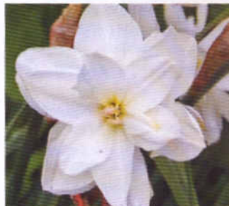
Н. поэтический разн. махровый