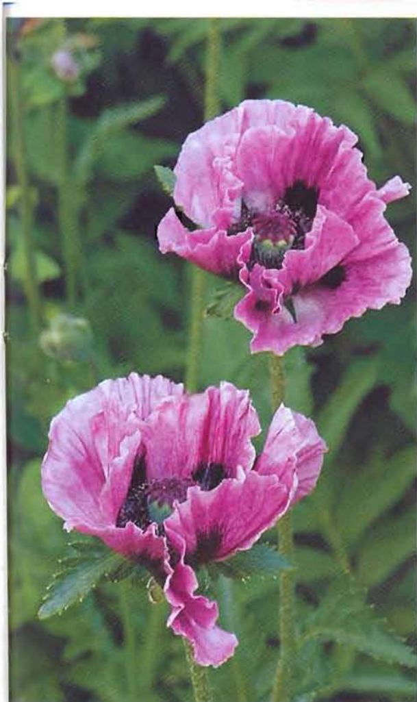
△ Мак восточный, сорт Manhattan