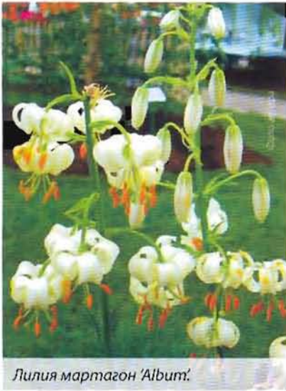
Лилия мартагон 'Album'.