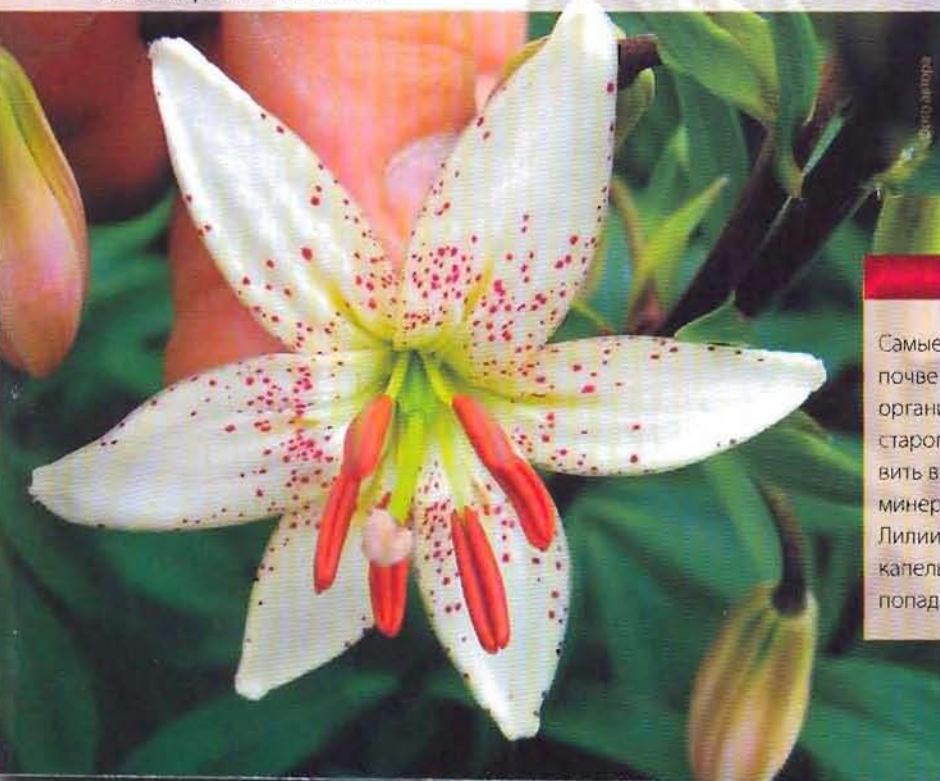
Лилия мартагон 'Albiflorum'.

Этим и объясняется невысокий интерес к лилии кудреватой среди отечественных и зарубежных селекционеров, профессионально занимающихся выращиванием и размножением этих растений. К тому же, при всей их изящности и красоте, этот вид в срезке очень объемный, и при транспортировке цветки и бутоны достаточно часто ломаются и потом имеют неговарный вид.