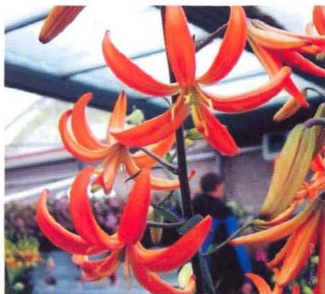
Лилия 'Specie Orange Marmelade'.