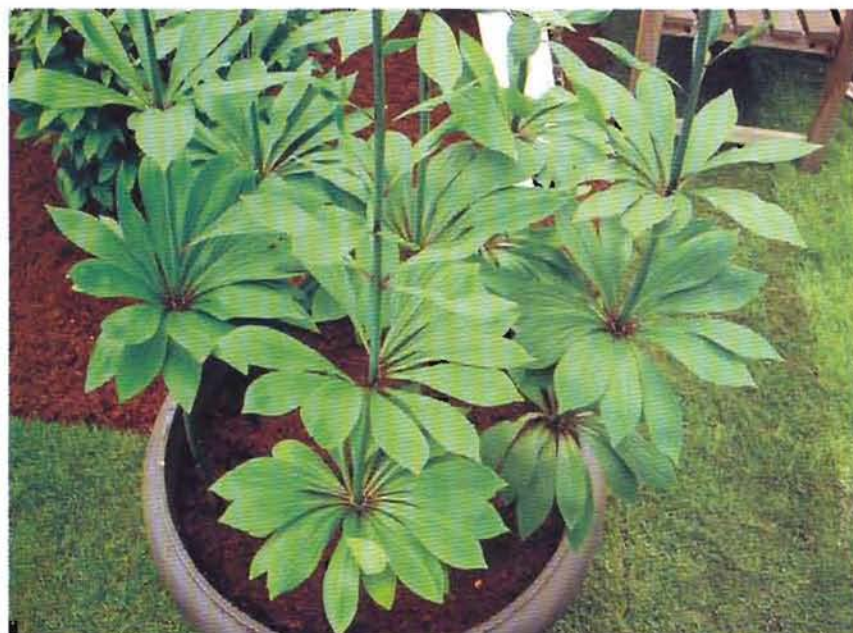
Листья лилии кудреватой собраны по 10–15 в 2–4 мутовки.