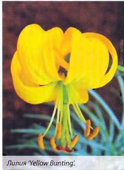
Лилия 'Yellow Bunting'.