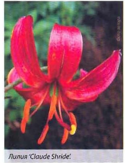
Лилия 'Claude Shride'.

сяцев, заканчиваясь в июле–августе, то есть только через год после формирования самой почки. И только после этого, в августе–сентябре, начинают закладываться цветочные почки. Таким образом, конец каждого лета — это наиболее важное время для правильного развития лилии кудреватой.