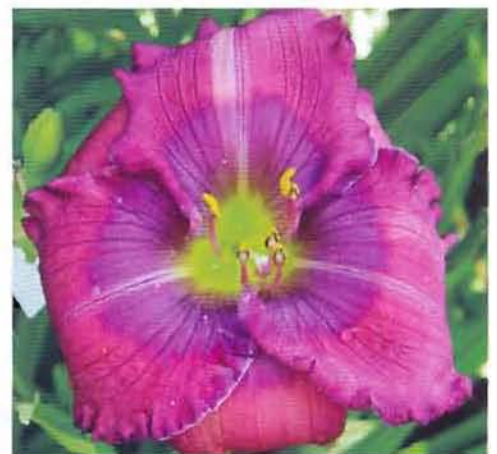
'Lavender Blue Baby'

раскрыться из-за недостатка тепла и света в нашей климатической зоне ( 'Dance Ballerina Dance' ). Особенно обидно, когда у дорогой новинки с огромным цветком и каймой в виде покорна или совиных ушей лепесткам не хватает сил распуститься из-за плотно сцепившейся бахромы.