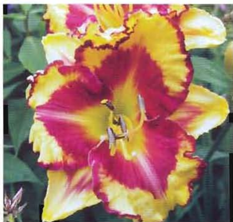
'Beyond The Moon'