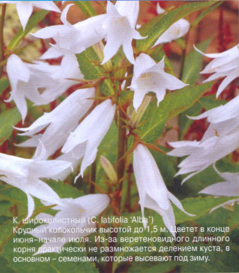
К. широколистный (C. latifolia 'Alba')

Крупный колокольчик высотой до 1,5 м. Цветет в конце июня – начале июля. Из-за веретеновидного длинного корня практически не размножается делением куста, в основном – семенами, которые высевают под зиму.