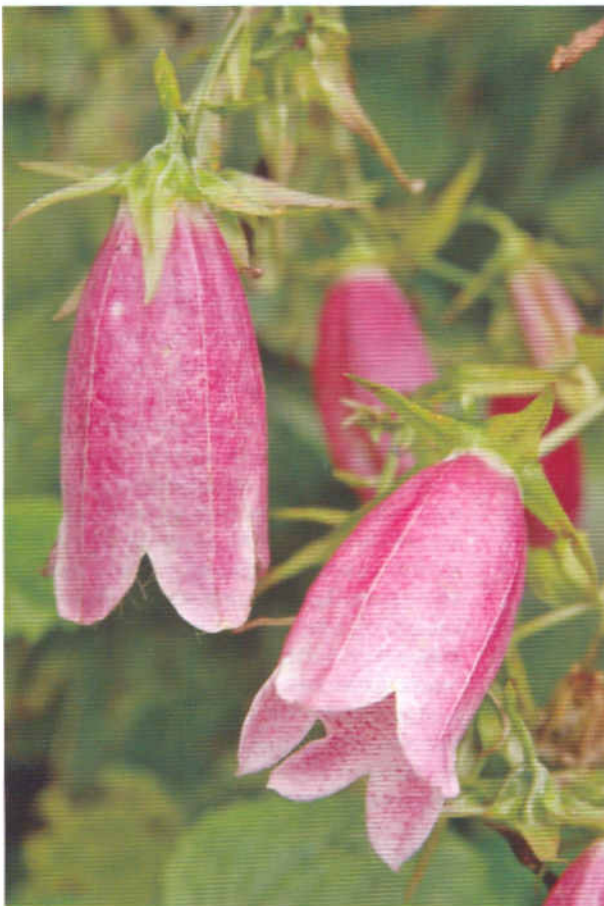
К. точечный ( C. punctata )

Многолетнее длиннокорневищное растение высотой 50–70 см с опушенными листьями, сидящими на красноватых черешках. Цветки грязно-розовые с пурпурными точечками, направлены вниз.