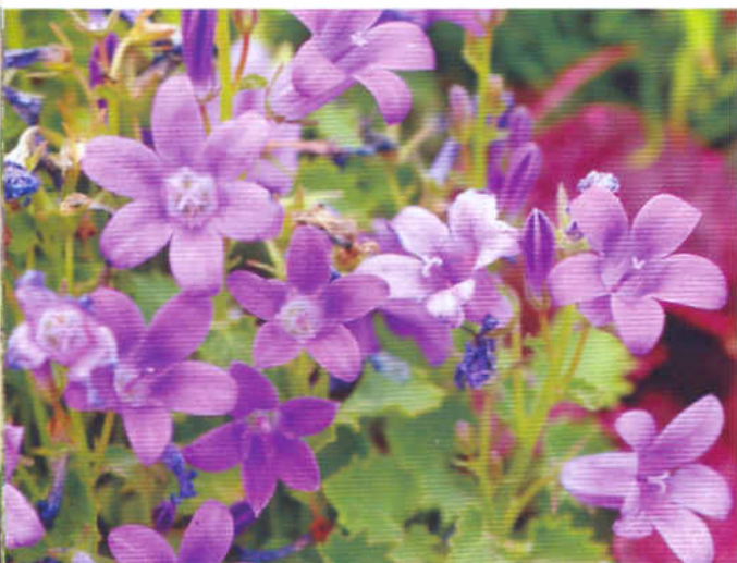
К. Портеншлага ( C. portenschlagiana )

Многолетник высотой до 15 см с довольно крупными ярко-фиолетовыми цветками, направленными вверх, что позволяет использовать его не только на приподнятых горках и террасах, но и в обычных цветниках на первом плане.