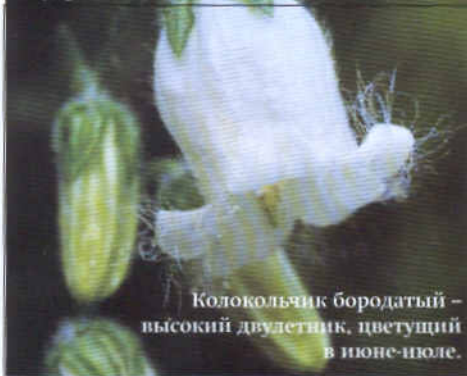
Колокольчик бородатый – высокий двулетник, цветущий в июне-июле.

тельно, с июня по август. Оба вида прекрасно размножаются и семенами, и корневыми отпрысками.