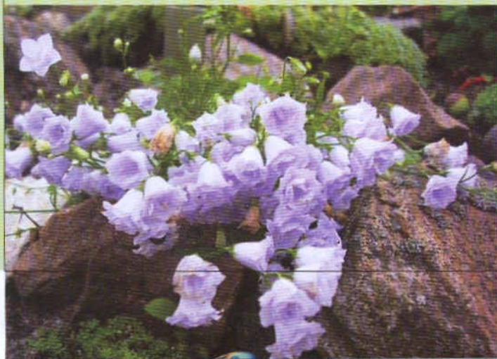
Колокольчик Радде, махровая форма.

Если аккуратно удалять увядшие цветки и засохшие цветоносы, то можно продлить срок цветения колокольчиков.