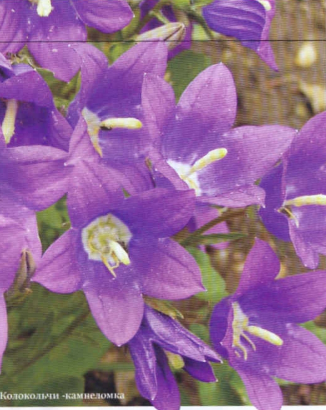
Колокольчик - камнеломка

Справа – колокольчик темный – очень маленькое альпийское растение с довольно крупными воронковидными цветками. Цветет в июне-июле. Размножается семенами, а также корневыми отпрысками и черенками. Лучше растет в легкой тени, на слабощелочной, хорошо увлажненной почве. Идеальное растение для рокариев.