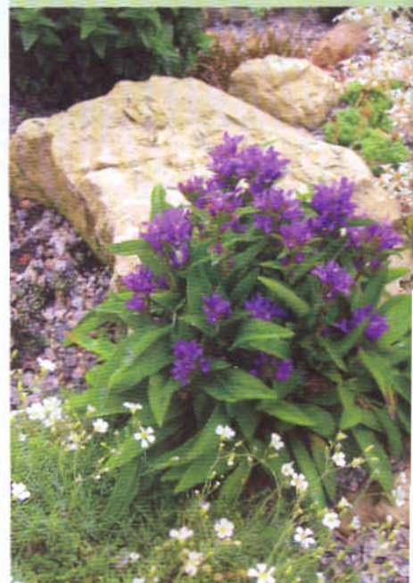
Колокольчик скученный, карликовая форма.

Если аккуратно удалять увядшие цветки и засохшие цветоносы, то можно продлить срок цветения колокольчиков.