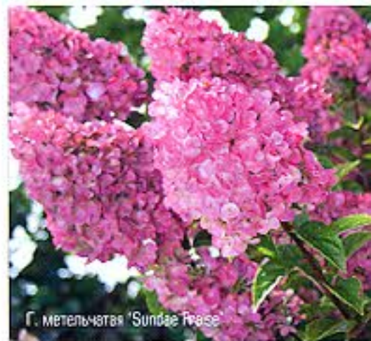
Г. метельчатая 'Sundae Fraise'

форма, незрочной зеленоватой окраски. При подготовке производственного плана этому сорту было отведено небольшое количество черенков, лишь бы был в ассортименте. Но как же мы ошиблись! На следующий год кусты гортензии быстро выросли, набрали силу и выдвинули просто гигантские конические,