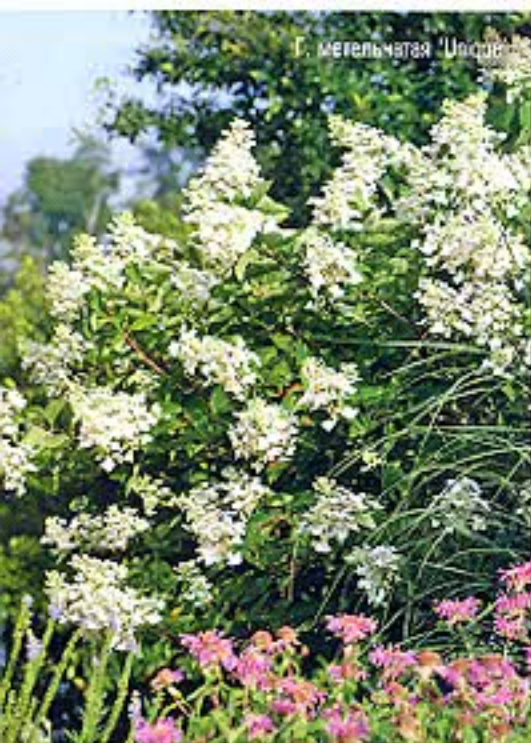
Г. метельчатая 'Wim's Red'

Гортензия не требует каких-то специальных сложных агротехнических мероприятий. Для ее успешного выращивания необходимо лишь соблюсти несколько простых приемов.