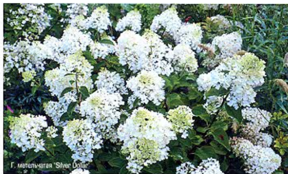
Г. метельчатая 'Silver Dollar'

слетка бархатистые, продолговатые, с характерной заостренной верхушкой. Цветки белые, немного розовеют по мере распускания, собраны в округлые, плоские соцветия, некрупные и состоят из двух типов: стерильных и фертильных. Цветет кустарник в июле – августе, относительно других сортов не слишком продолжительно.