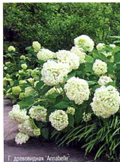
Г. древовидная ‘Annabelle’

приобретают насыщенно-розовую окраску. Но постепенно этот цветовой эффект исчезает, соцветия становятся