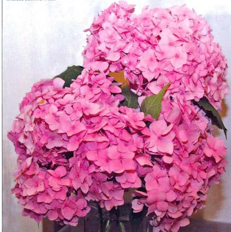
'Endless Summer Pink'

● Правильная регулярная обрезка обязательна для всех красивоцветущих кустарников. У взрослой гортензии осенью обрезают соцветия, а весной до пробуждения почек прореживают куст, вырезав «на кольцо» слабые и растущие внутри кроны ветки. Однолетние побеги следует укоротить до 3–5 пар почек. Тогда цветение с каждым годом будет становиться все пышнее.