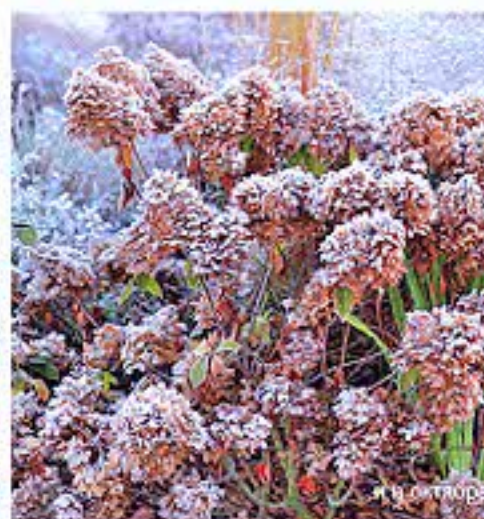
... в октябре

нужно добавить перепревший словый или сосновый опад, кислый рыжий торф или полуперепревшие опилки. Очень хороший результат дает внесение земляной смеси для рододендронов. Ни в коем случае не добавляйте мел, золу, известь и другие раскислители.