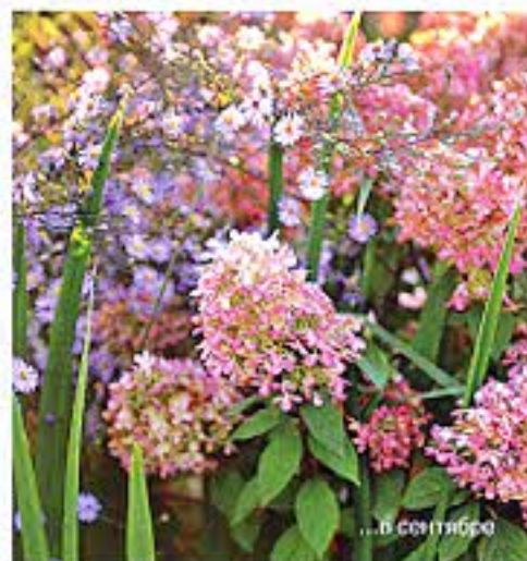
... в сентябре