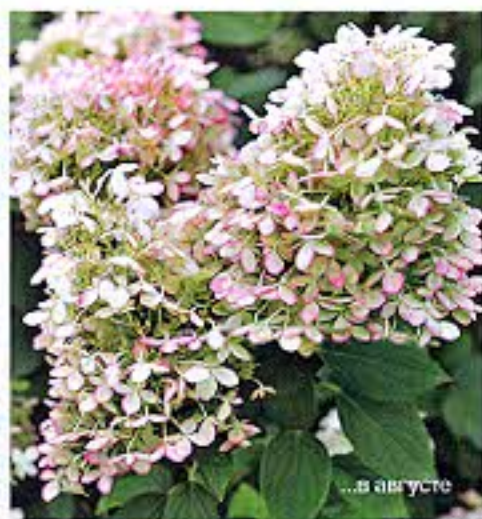
... в августе