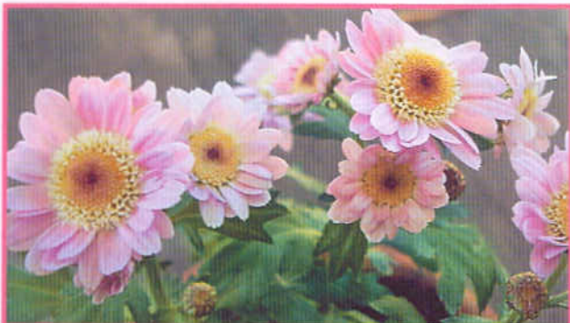
Взрослый куст миниатюрного сорта Nila высотой всего 30 см

Лучше покупать заморских красавиц весной с цветками. Приобретенное растение следует пересадить в новый грунт и поставить на свежем воздухе. С увеличением свето-