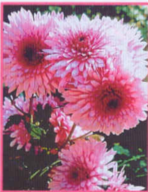
Окишор - поздний высокорослый сорт