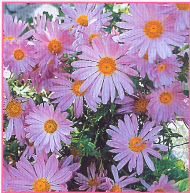
Гибридная форма корейской хризантемы