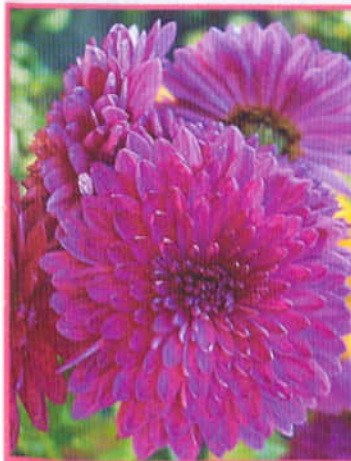
Высокорослый сорт Стелуца

шем поливе и внесении подкормок хризантема порадует цветением еще несколько недель. Я как-то попробовала оставить горшечную хризантему зимовать высаженной в грунт. Ничего из этого не вышло. На следующий сезон она не проросла. Даже кусты, находившиеся под хорошим укрытием, весной не подали признаков жизни.