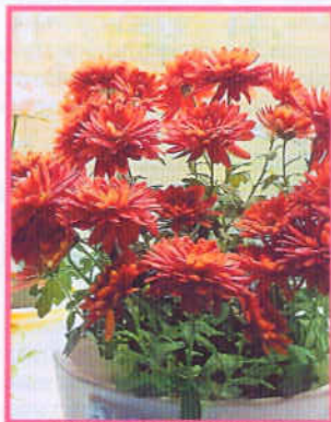
Очень ранний сорт Гранатовый Рассвет