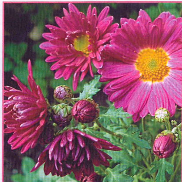
В моей коллекции раньше всех зацветает сорт Джилли

Когда минует угроза заморозков и установится теплая погода, черенки можно высадить в грунт. Для формирования пышного куста следует прищипывать верхушки побегов, что стимулирует рост спящих почек. Первую прищипку провожу над 4-5-й парой листьев, вторую -