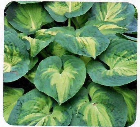
▲ 'Great Expectations'