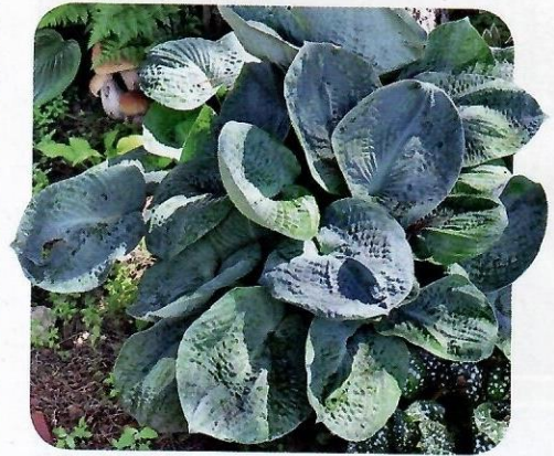
▲ 'Big Daddy'