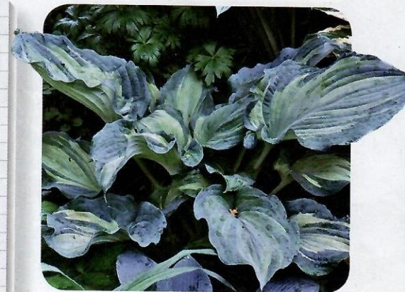
▲ 'Guardian Angel'