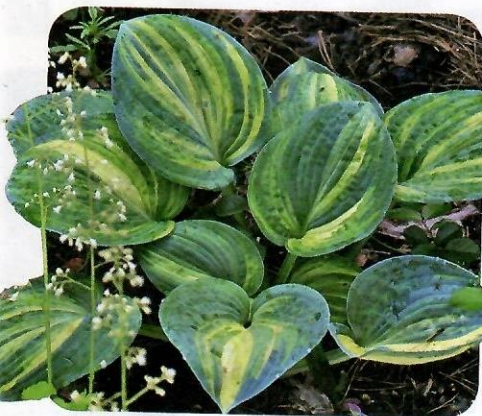
▲ 'Ice Age Trail'

'Liberty' — довольно крупный куст высотой 60 см, с плотными, слегка волнистыми сердцевидными листьями 30x25 см. У меня эта хоста растет у входа в дом — так, чтобы ее было видно издалека. Вазообразный куст украшают большие парящие листья с ярко-желтой, очень широкой каймой по краю и сизой, голубовато-зеленой серединой. Этот сорт — лидер весеннего сада. Кайма по краю напоминает атласную ленту, перетекающую в центр листа. С годами она становится очень широкой, и у растений старше 5—7-летнего возраста может занимать большую часть листа. Постепенно