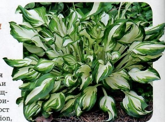
▲ Хоста волнистая

'Ice Age Trail' — один из современных сортов. Имеет продольные сливочные полосы и штрихи. Два одинаковых листа не найдешь. Хоста среднего размера, с почти круглыми сине-зелеными, размером 18x15 см листьями. Одна моя знакомая прозвала ее «арбузик». По-моему, очень точное название.