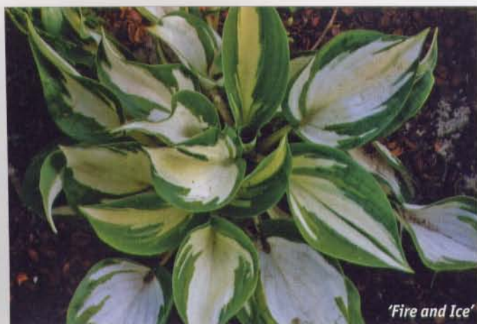
'Fire and Ice'