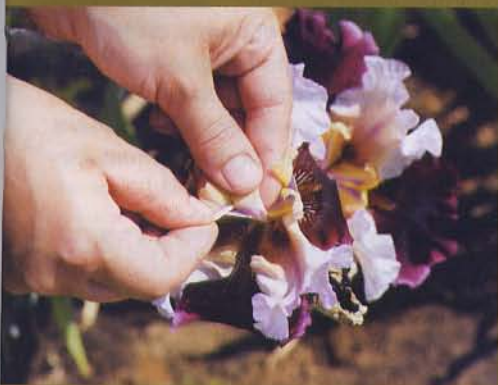
3 Переносим пыльцу на среднюю часть рыльца каждого из пестиков