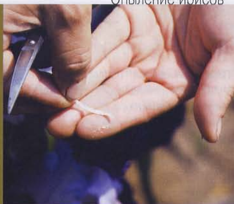
2 Срезаем тычинку с ириса, пыльцой которого собираемся опылять