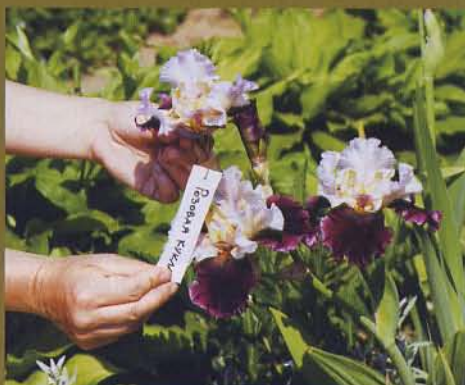
4 На завязи закрепляем бирку с именем «отцовского» растения

«Это самое потрясающее занятие из всех, которые только возможны в садоводстве» — слова замечательного селекционера Г. Родионенко