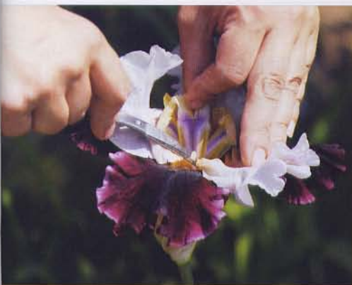
1 У материнского растения удаляем тычинки и нижние лепестки (фолсы)