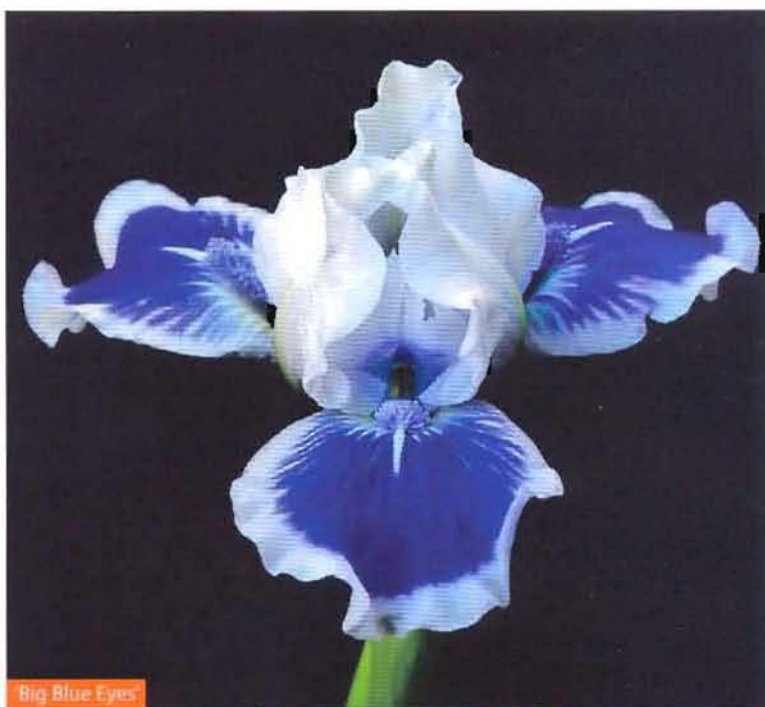
Big Blue Eyes

Карлики унаследовали цвета и узоры всех своих предков. Визитной карточкой их цветков стало контрастное пятно на фалах — отличительная черта Iris pumila . Если у дикорастущего ириса это пятно малозаметно на подвёрнутых фалах, то на широких горизонтальных долях