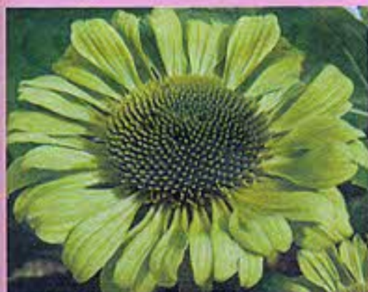
△ Green Jewel