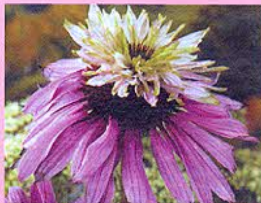
△ Double Decker

У сорта King язычковые цветки поникшие, тускло-розовые, куст высотой 100 см; у Bressingham язычковые цветки ярче; у Granatstern язычковые цветки пурпуровые с зубцами на верхушке; мощный куст с очень крупными розово-красными соцветиями у сорта After Midnight ; темно-пурпурный красавец — Fatal Attraction ; Mars — очень необычная эхинацея с огромной круглой «шишкой» в центре цветка; Lilliput — прелестная малышка высотой всего 45 см; сорт Merlot отличается высотой 75 см, светло-розовыми соцветиями и окрашенными в темный винно-красный цвет черешками листьев и цветоносами; изюминка сорта Raspberry Tart — обилие небольших темно-красных соцветий, высота растения 60 см. Есть два махровых сорта с «юбочкой» понизу