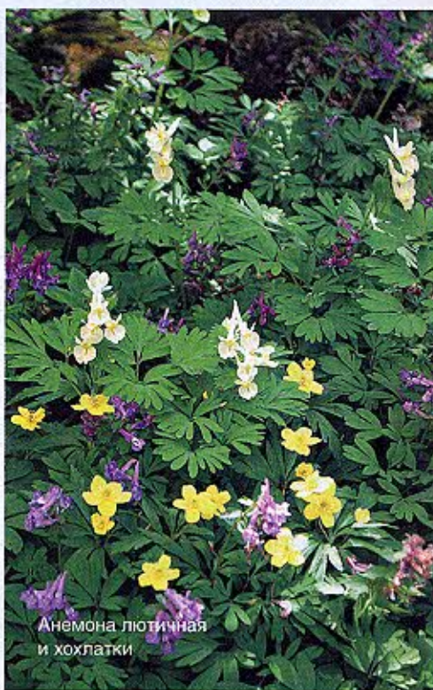
Анемона лютичная и хохлатки