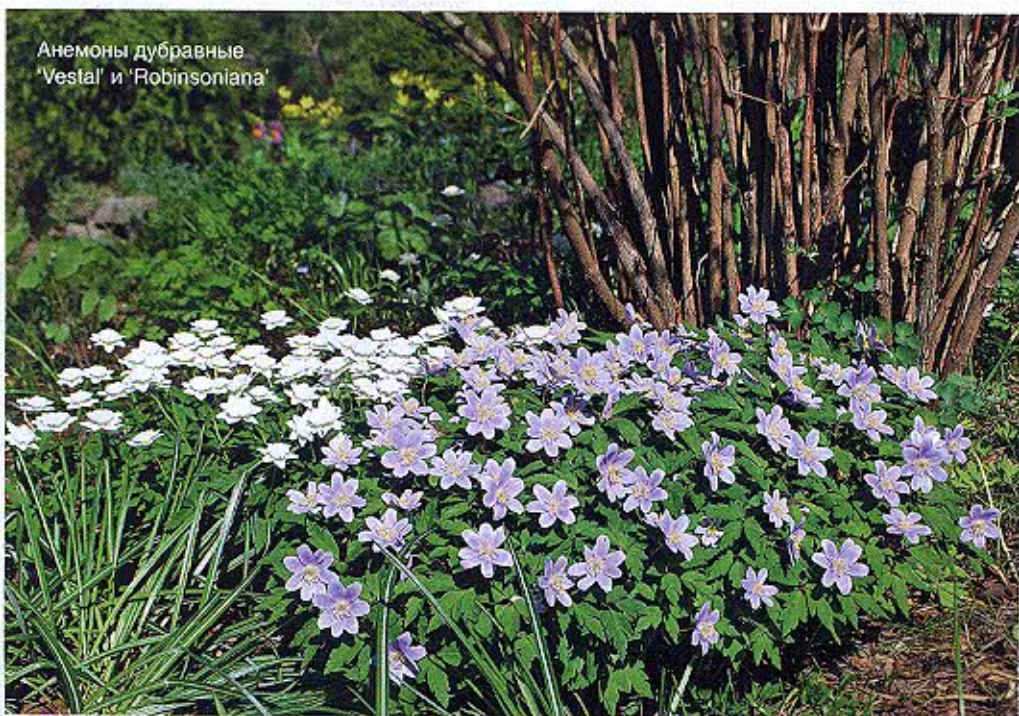
Анемоны дубравные 'Vestal' и 'Robinsoniana'

Как всяким лесным растениям, этим анемонам надо предоставить в саду условия, подобные тем, в которых они растут в природе: затененное прохладное место, дренированную почву с наличием листового перегноя в составе. Садовый компост в качестве добавки к грунту тоже подойдет. Большинство видов предпочитают расти в скользящей тени или полутени, но а. нежная и а. кавказская ( A. caucasica ) более светолюбивы: в природе (Балканы, Кавказ) растут на опушках и среди кустарников. Полив только в засуху, подкормки и обрезка засохших листьев не нужны, а прополка выполняется один раз, но тщательно – перед посадкой участок должен быть освобожден от сорняков, особенно корневищных. В дальнейшем плотность куртины и регулярное мульчирование листовым перегноем или легким компостом сведут на нет появление сорняков. Если анемоны посажены вблизи хвойных или лиственных деревьев и кустарников, опад лучше не убирать: он, перегнивая, обогатит почву питательными веществами и будет служить естественной мульчей. ▶