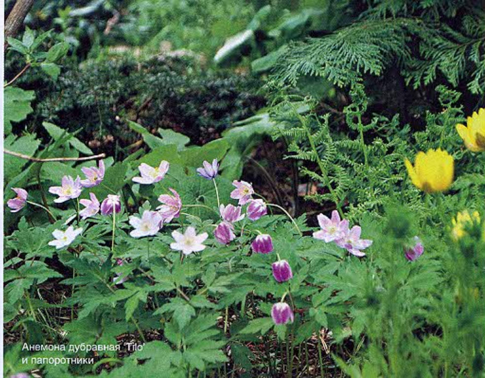
Анемона дубравная. Тло и папоротники

Выбираем и заказываем по каталогам новые сорта.