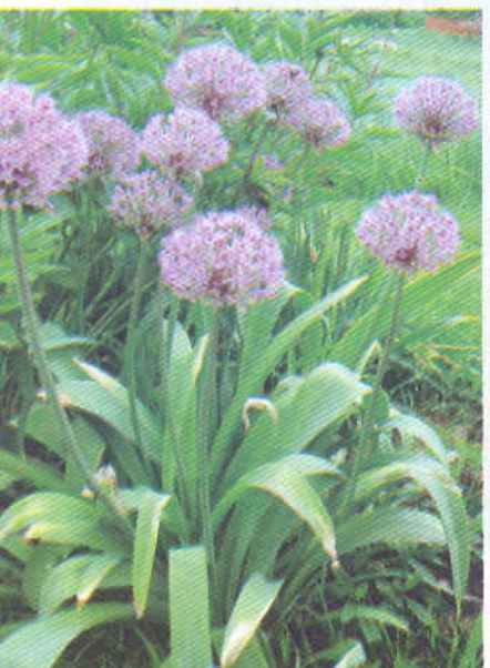
Лук гибридный Naig